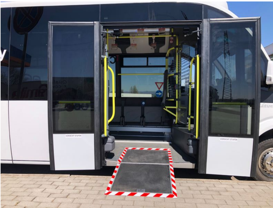
Breiter Einstieg vorne mit Rampe.