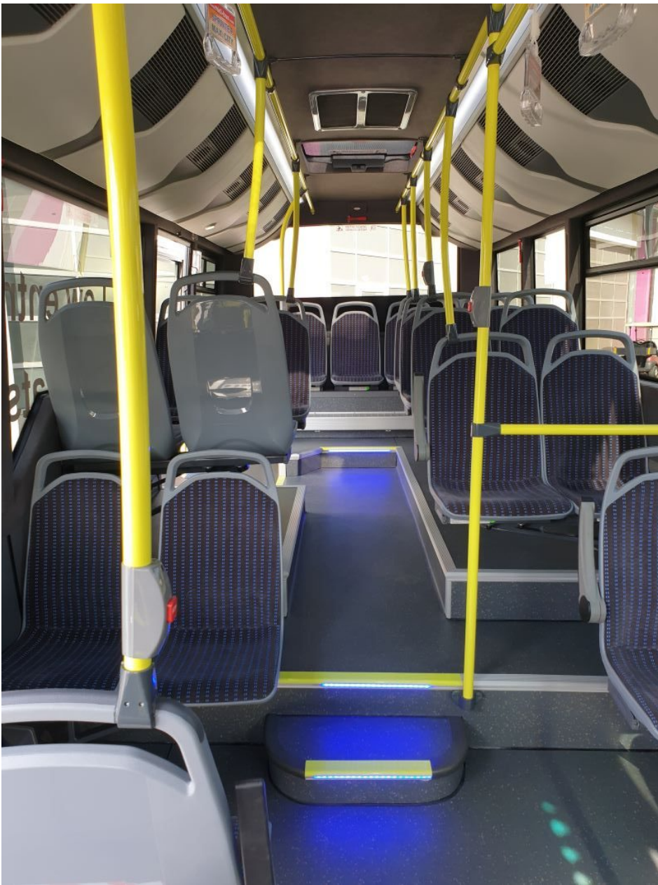
Innenansicht des neuen »Maxi Sprinter City« (Bild: Albert Kronberger).