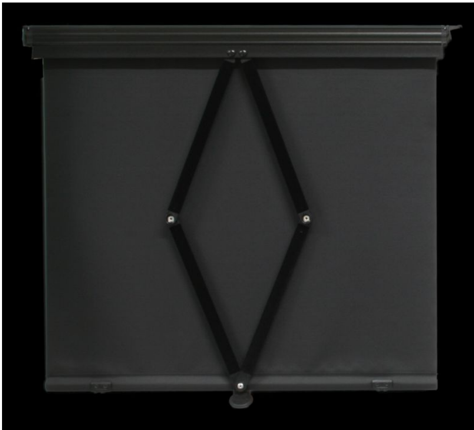
Mechanisches Sonnenrollo Fahrerseite passend für Volvo.

Das Sortiment umfasst aktuell über 70 verschiedene Modelle, Front- und Seitenrollos, elektrisch und mechanisch, für Decken- oder Wandbefestigung. Alle Sonnenrollos bieten einen optimalen Sonnenschutz. Die einfache Montage und Bedienung zeichnet die Produkte aus und macht sie durch ihre Langlebigkeit nachhaltig. Der A&K Omnibusfachhandel stellt sich im Bereich Sonnenrollos kontinuierlich breiter auf, sodass nahezu alle Anfragen bedient werden können.